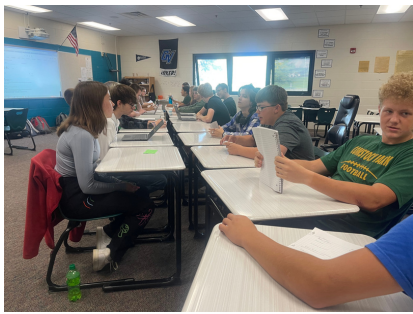
Students participate in a "speed-debate" in AP Government